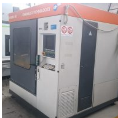
Elettro Erosione Robofil 510 INFILAGGIO AUTOMATICO Macchina