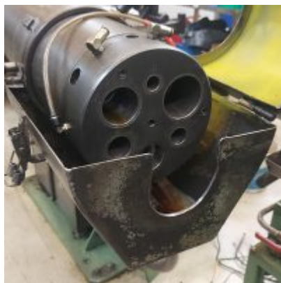
Spingibarra tubo ASMUT usato Spingibarra Asmut a bagno d'olio, per Tornio cnc. Passaggio barra 15-22-29-36-43-46

Tutti i dati tecnici riportati sono indicativi e possono essere modificati senza preavviso e pertanto essi non devono essere ritenuti impegnativi